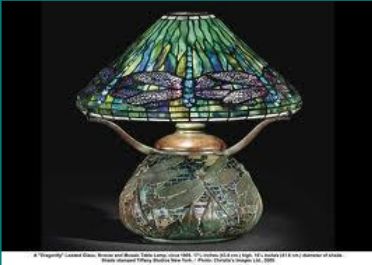
A "Dragonfly" Leaded Glass, Bronze and Brass Table Lamp, circa 1900. 10 1/2 inches (26.8 cm.) high, 10 1/2 inches (26.8 cm.) diameter of shade. Shade stamped Tiffany Studios New York.